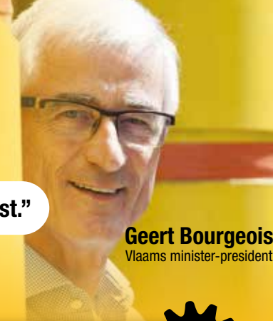
Geert Bourgeois Vlaams minister-president

“Deze Vlaamse Regering beslist, hervormt en tekent het Vlaanderen van de toekomst.”