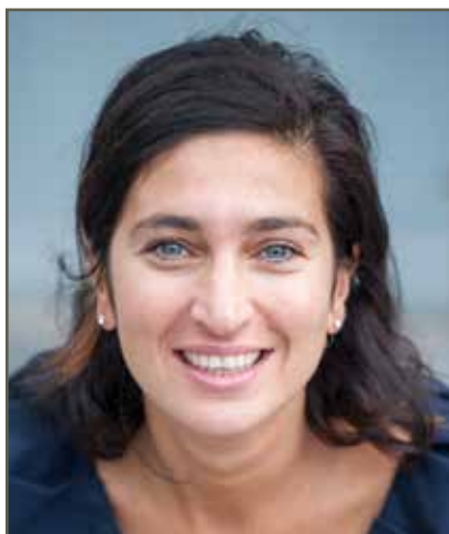
Zuhail Demir staatssecretaris