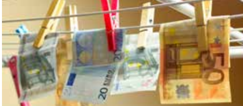
Geen graaicultuur bij N-VA Bertem p.2