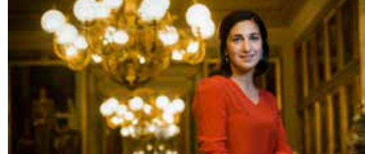
Vrouwen in de politiek p.3